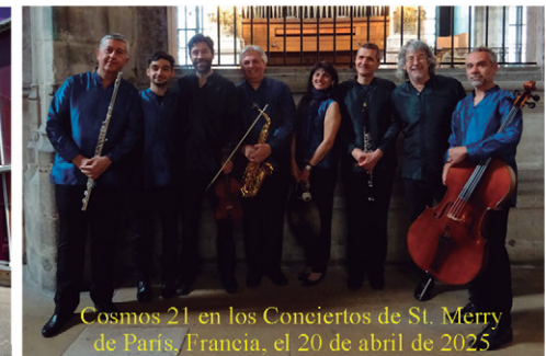
Cosmos 21 en los Conciertos de St. Merry de París, Francia, el 20 de abril de 2025