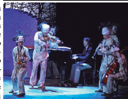
Los miembros de Cosmos 21 interpretando en el Teatro de la Zarzuela tres números de “a-Babel” disfrazados de músicos locos

En cierta ocasión escuché que en tu obra se vivía la paradoja de simultanear la libertad formal como propuesta con la implantación de unas cerradas reglas de funcionamiento: el azar y el control. ¿no es dicha convivencia sino una de las definiciones sustanciales del juego? Cuando me refiero al azar siempre lo cuestiono como una necesidad de algo que se produce con limitaciones queridas, limitaciones que provienen por medio de un control. En mi música, tanto el azar como su generador por medio de la improvisación están controlados por la manera de cómo preparo la llegada al momento de la improvisación, cómo, a ser posible, llevo al intérprete a la característica de un tipo de improvisación que deseo para el contexto y coherencia de la obra, de una obra en concreto. Esta es la explicación por la cual cada obra donde existe y requiere la improvisación tiene su particular personalidad, razón por la cual no toda grafía improvisatoria sirve para toda obra. El azar es, en este caso, consecuencia del control que resulta de la improvisación que se ha creado. Pienso que cuando se entra en el mundo de la improvisación y del azar como consecuencia lógica de lo impredecible, se está implícito en lo aleatorio, tres elementos o conceptos o procedimientos para la expresión sonora que fácilmente se concatenan y que es necesario diferenciar por medio de la grafía, si se quiere ser pulcro y dependiendo de lo que se necesite, y me gusta