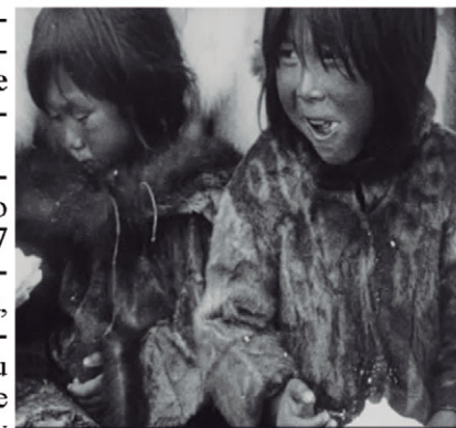
Fotograma de "Nanuk el esquimal"

Esta "improcomposición" o "compoimprovisación" fue un encargo que el Instituto Valenciano de la Música me hizo en 2007 para ser estrenada por el Impromptu Ensemble, una agrupación con base en Valencia, formada por músicos improvisadores de primer nivel y de la que formé parte desde su fundación y durante más de una década. De ahí que la partitura tenía que ser muy abierta y con mucha libertad para el sexteto de músicos que participó en aquel estreno.