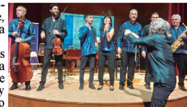
Cosmos 21 en “Lluita” de Mestres Quadreny, en Músicas del Cosmos 2025